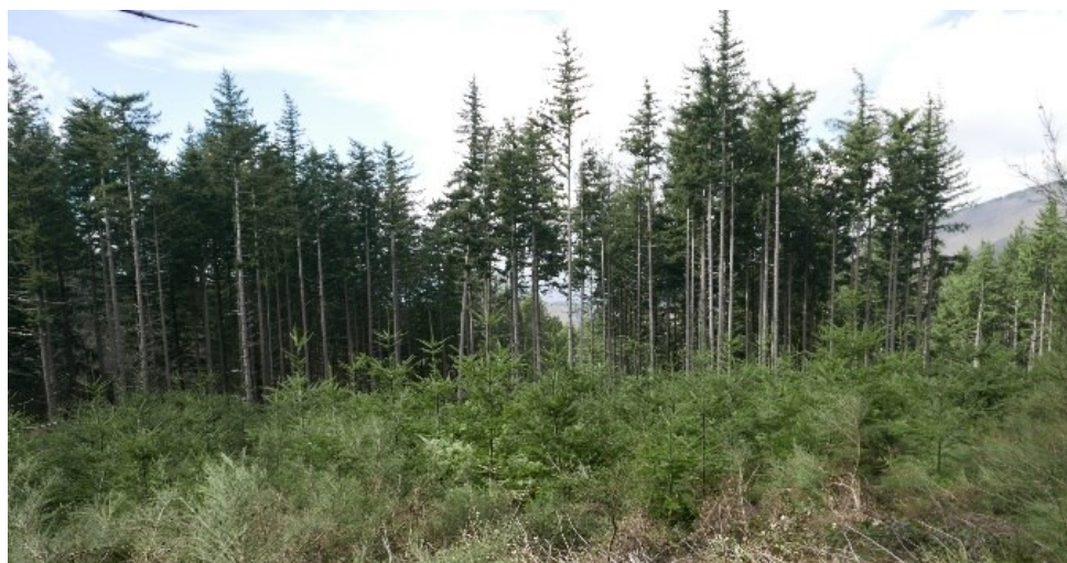
Az. Rincine taglio a strisce con rinnovazione artificiale (F. Pelleri)